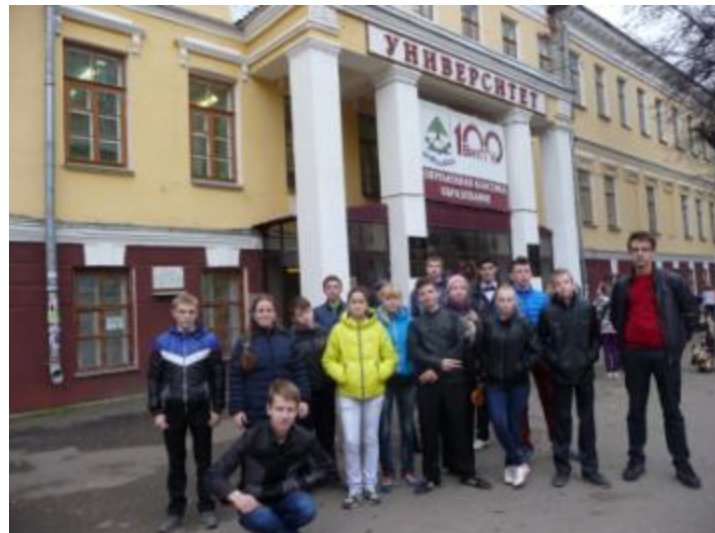
Вятский государственный гуманитарный университет.