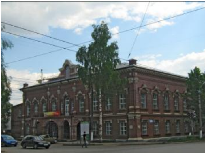
Московская финансово-юридическая академия

На перекрёстке улиц Ленина и Красноармейская находятся МФЮА и ВятГГУ.