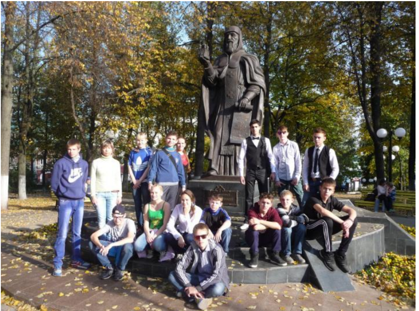
В сквере, около здания Центральной гостиницы и ресторана «Россия» открыт памятник преподобному Трифону Вятскому.