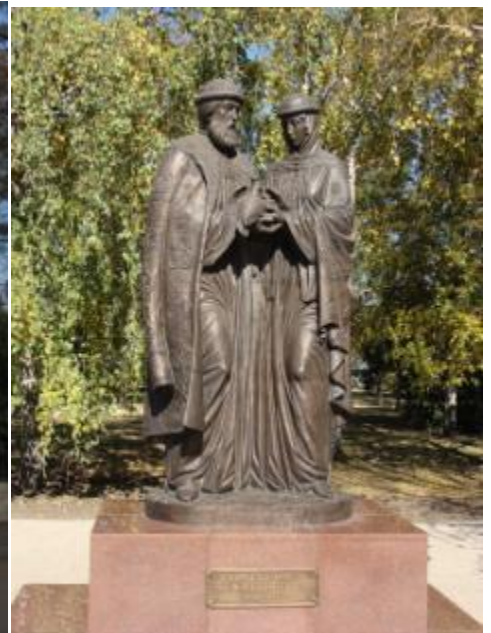
В Александровском саду мы сфотографировались у памятника Петру и Февронье.