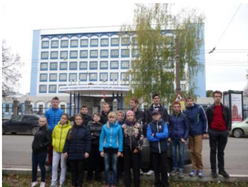
Далее построен новый корпус ВятГГУ.